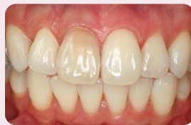
施術6回 終了時 H.25.7.30