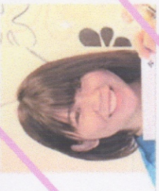
受付 トリートメント コーティング ター