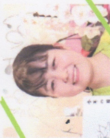
栄養士 栄養カウンセラー